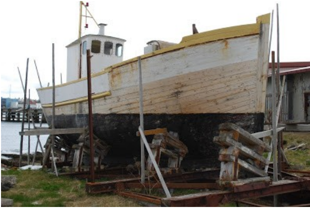
Einar II på slippen i Vardø, hvor den stod fra 1997 til sept. 2011