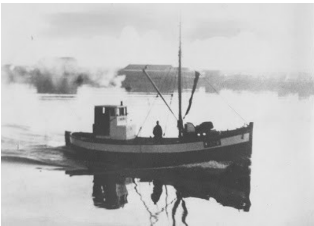
Opprinnelig var Einar II 35 fot, og hadde skøytehekk med sleperor