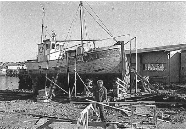
Einar II ble satt på slippen i Vardø 1997. Bildet er tatt før masta ble demontert.

Fartøyet har beholdt trestyrhus, men det er lagt aluminiumsfront. Videre er rekke, skanseledning og romluke utført i aluminium. Fartøyet har krysserhekk og opprinnelig kjettingstyring erstattet med hydraulisk styring. Det er stål aktermast og bilde fra 1997 viser formast av tre. Denne er imidlertid demontert. Det er tradisjonell innredning i lugar, men det er uvisst om denne er original. Nedgangskappe er av tre.